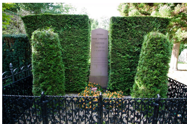
Писатель скончался в 4 августа 1875 года и был похоронен в Копенгагене.

Годы, проведенные в школе, он вспоминал как самые мрачные за всю жизнь. Там он постоянно подвергался критике ректора и болезненно это переносил. В 1827 году учеба закончилась, а в 1829 году был опубликован первый рассказ Андерсена – « Пешее путешествие от канала Холмен к восточной оконечности Алмагера ». Несмотря на то, что это произведение было из разряда фантастики, именно оно принесло писателю известность. В 1833 году король снабдил писателя деньгами на путешествие. После этого появилось большое количество произведений, прославивших его, в том числе и знаменитые «Сказки». 1835 год был ознаменован появлением первого романа Андерсена « Импровизатор », который пришелся по душе критикам. Последняя сказка Андерсена вышла в свет в 1872 году в канун Рождества. Как сказочнику и величайшему автору ему не было равных в Дании.